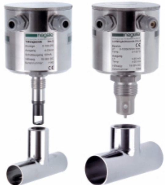
Sensoren zur Phasentrennung. links das Trübungsmessgerät itm-2; rechts das Leitfähigkeitsmessgerät ilm-2. Beide mit aseptischem Einschweißrohr Typ EHG.

=> minimale Produktverluste; keine Qualitätsunterschiede; hohe Sicherheit; kein Personalaufwand